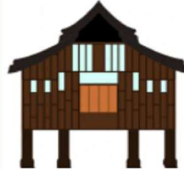
Homestay (to stay)