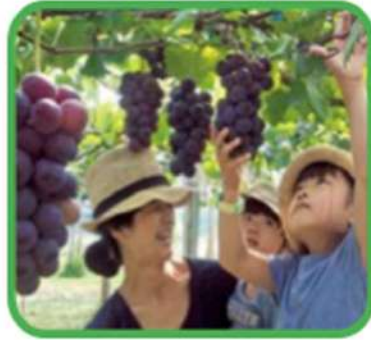
Petik Anggur (to do)