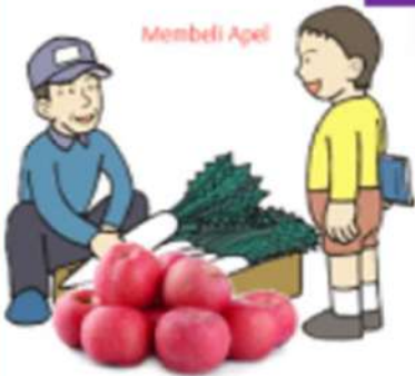
Membeli apel (to buy)