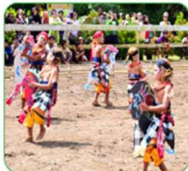
Seni tradisional (do+learn)