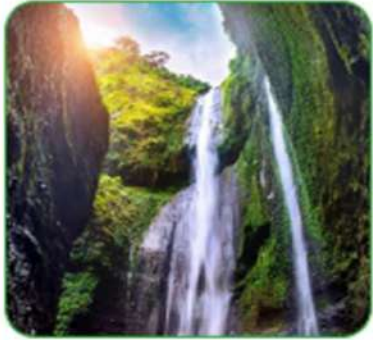
Object (to see)