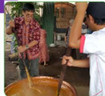
memasak (to learn)